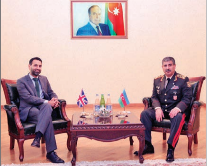
Eyni zamanda, müdafiə naziri general-polkovnik Zakir Həsənovun Böyük Britaniya planlaşdırılan səfəri barədə məsələlər də müzakirə edilmişdir.

Müdafiə Nazirliyinin mətbuat xidmətindən AZƏRTAC-a bildirilib ki, görüşdə Ermənistan-Azərbaycan, Dağlıq Qarabağ münaqişəsi, Azərbaycanın işğal edilmiş ərazilərindəki qondarma separatçı rejimin nümayəndələrinin bəzi beynəlxalq qurumlar tərəfindən qəbul edilməsinin narahatçılıq doğurduğu diqqətə çatdırılıb. Həmçinin bölgədəki hərbi-siyasi vəziyyət, ölkələrimiz arasında hərbi əməkdaşlıq və regional təhlükəsizlik məsələlərinə dair fikir mübadiləsi aparılıb.